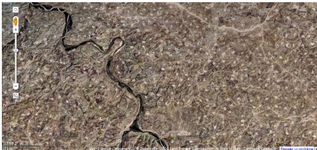
Chacun des points blancs sur la carte est un puits d'extraction de gaz de schiste

A 2500 m de profondeur, c'est un petit tremblement de terre : pour réunir les micropoches en une unique poche de gaz, un explosif est détonné pour créer des brèches. Elles sont ensuite fracturées à l'aide d'un mélange d'eau, de sable et de produits chimiques propulsé à très haute pression (600 bars) qui fait remonter le gaz à la surface avec une partie de ce "liquide de fracturation". Chacun de ces "fracks" nécessite de 7 à 15 000 mètres cube d'eau (soit 7 à 15 millions de litres), un puits pouvant être fracturé jusqu'à 14 fois. Selon la couche de schiste, un puits peut donner accès à des quantités de gaz très variables, précise Aurèle Parriaux, docteur en géologie de l'ingénieur à l'université polytechnique de Lausanne. Pour être sûr de rentabiliser un champ il faut une forte densité de forage. Dans le Garfield County (Colorado), le désert s'est hérissé de puits de gaz de schiste tous les 200 mètres.